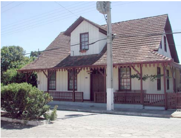
Fig. 6 – Residência do entorno da Igreja