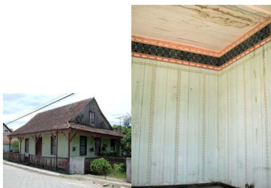
Fig. 1- Foto de residência típica –externa e interna

a preservação do Patrimônio Cultural, foram enfatizados, no projeto do Curso Técnico em Conservação e Restauração com ênfase em Pintura Mural, disciplinas teóricas e práticas que possam fundamentar o trabalho de conservação e restauração da pintura mural. Crê-se que a única forma de preservar o patrimônio seja através da educação. É propósito deste curso valorizar e mostrar a dignidade do trabalho técnico, porque quem trabalha com as mãos não faz trabalho menor. E, nesta dinâmica tecnológica e científica da conservação preventiva, este indivíduo deverá ter o acesso e o processo do conhecimento para a devida qualificação técnica. Lembrando que a ação do futuro técnico deverá ser crítica e reflexiva, respeitando integralmente o objeto de estudo no contexto sócio cultural em que se encontra, amparada nos princípios éticos que a profissão exige.