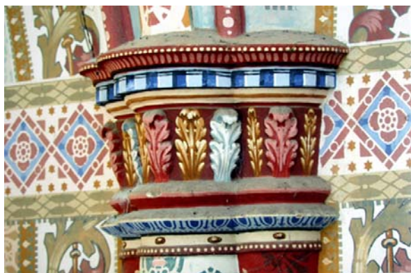
Fig.4 - Pintura Mural

A pintura mural da Igreja de Santo Estanislau foi executada por Evaldo e Valdemar Ducat, da cidade de Irati. Os motivos da pintura mural são fitomórficos, modulares, geométricos e painéis artísticos configurando-se harmoniosamente nas paredes, nos arcos, forros e abóbadas. Um conjunto de técnicas, materiais e composição artística que fazem parte da memória desta cultura. As Figuras 4 e 5 abaixo, representam detalhes da pintura mural com motivos decorativos e artísticos.