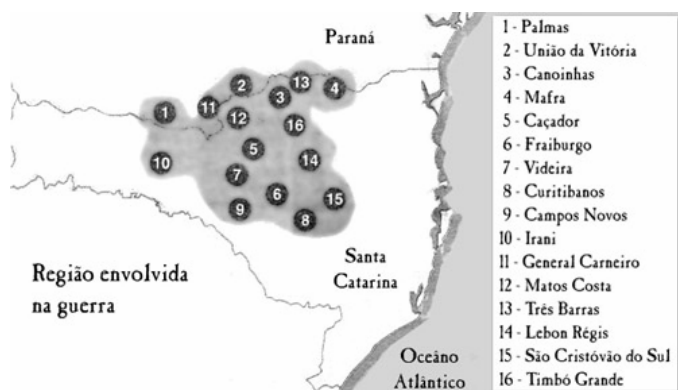
Fig. 3 - Mapa da região contestada

Mafra. A Figura 3 abaixo representa um mapa da região contestada.