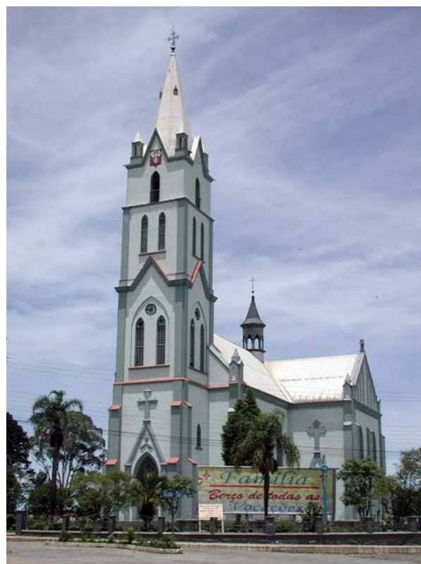
Fig. 2 - Igreja de Santo Estanislau

A fé do imigrante polonês não se manifesta apenas na edificação de templos religiosos, mas também em sua força moral e religiosidade, “em muitas colônias do Brasil a Igreja, a Paróquia e o Padre eram o ponto que unia a todos” (RODYCZ, 2002). Na Igreja de Santo Estanislau, por exemplo, as missas de Páscoa realizam-se até hoje no idioma polonês. A planta desta Igreja foi encomendada em Stojanów, na Polônia em 1911, pelo Pe. João Kominek, sofrendo algumas alterações pelo Pe. Francisco Chylaszek, caracterizando-se no estilo neogótico, em formato de cruz latina. Figura 2.