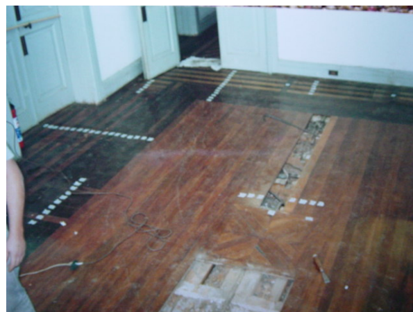
Fig. 02 – abertura do piso para intervenção no forro do pavimento térreo.

Após a remoção dos cordões e rodapés, o assoalho foi todo removido com o máximo cuidado para evitar qualquer perda. O trabalho teve início em lados paralelos ao sentido das tábuas com o corte do macho das duas primeiras, as restantes foram despregadas aos poucos e simultaneamente em toda sua extensão.