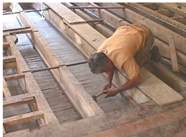
Fig.05 – instalação das telas de arame galvanizado.

Imediatamente após a mistura dos mesmos componentes da resina, foi misturada argila expandida nº zero. Os arames fixados na tela ficaram para fora da camada de resina como arranques para posterior amarração na estrutura.