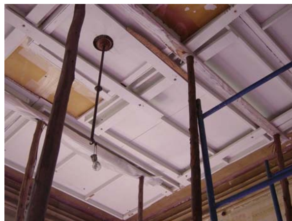
Fig. 01 – escoramento do forro do mezanino da Vila Penteado