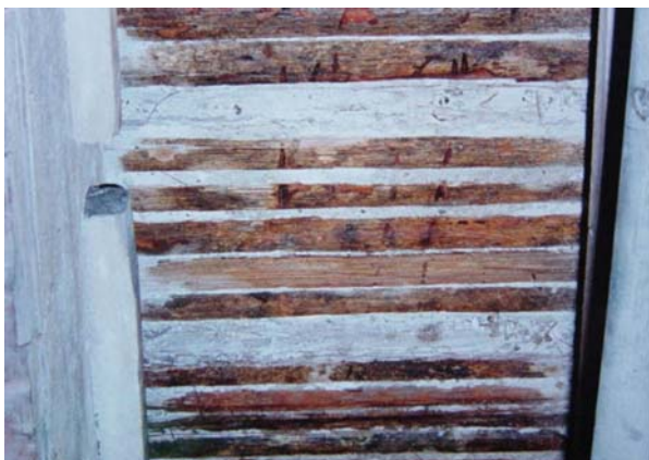
Fig. 04 – fasquias de juçara com a primeira camada de resina acrílica.

Após a total secagem do produto anti-cupim foi feita a aplicação da primeira camada da resina acrílica bicomponente e autonivelante. Imediatamente antes da aplicação da resina a superfície foi umedecida com água utilizando-se pulverizador de maneira a evitar sua saturação.