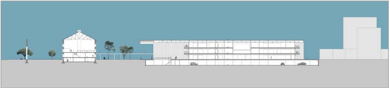
Fig. 11 Corte BB sem escala