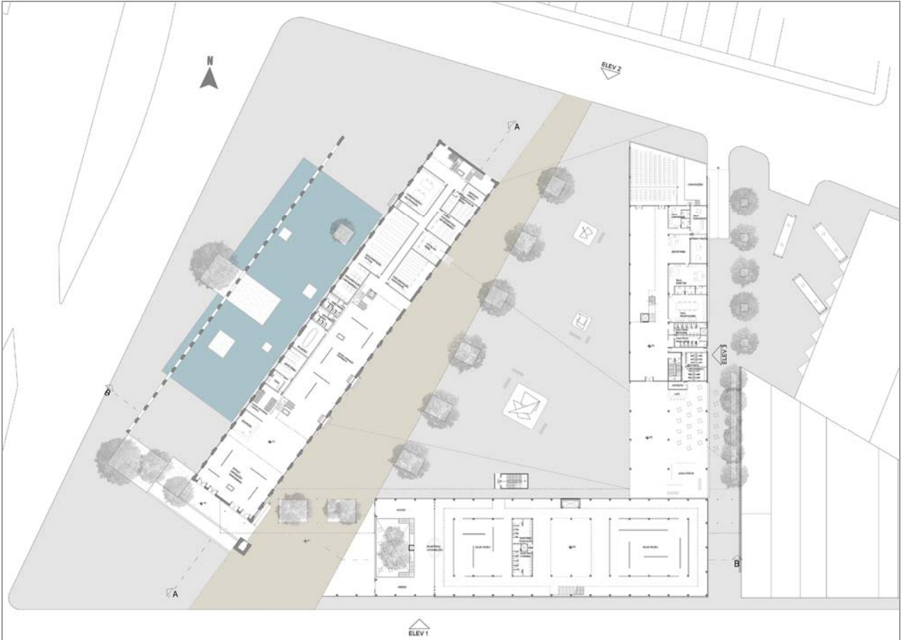
Fig. 8 Planta Térreo sem escala