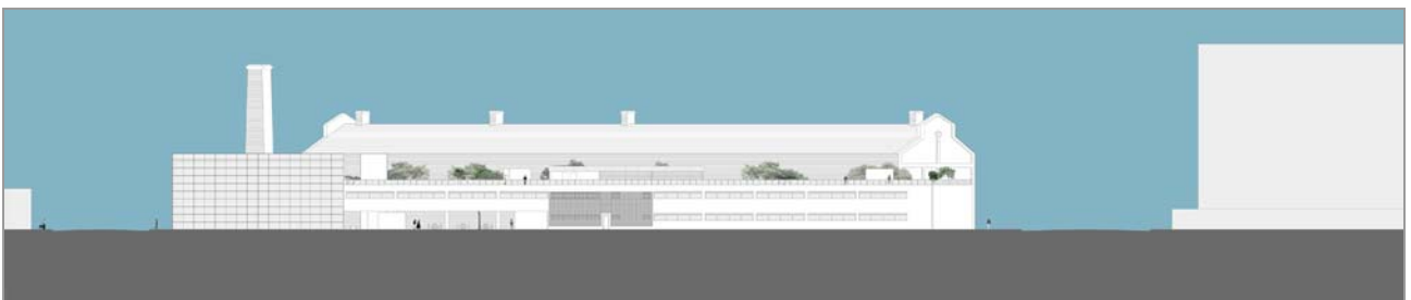
Fig. 14 Elevação 3 sem escala