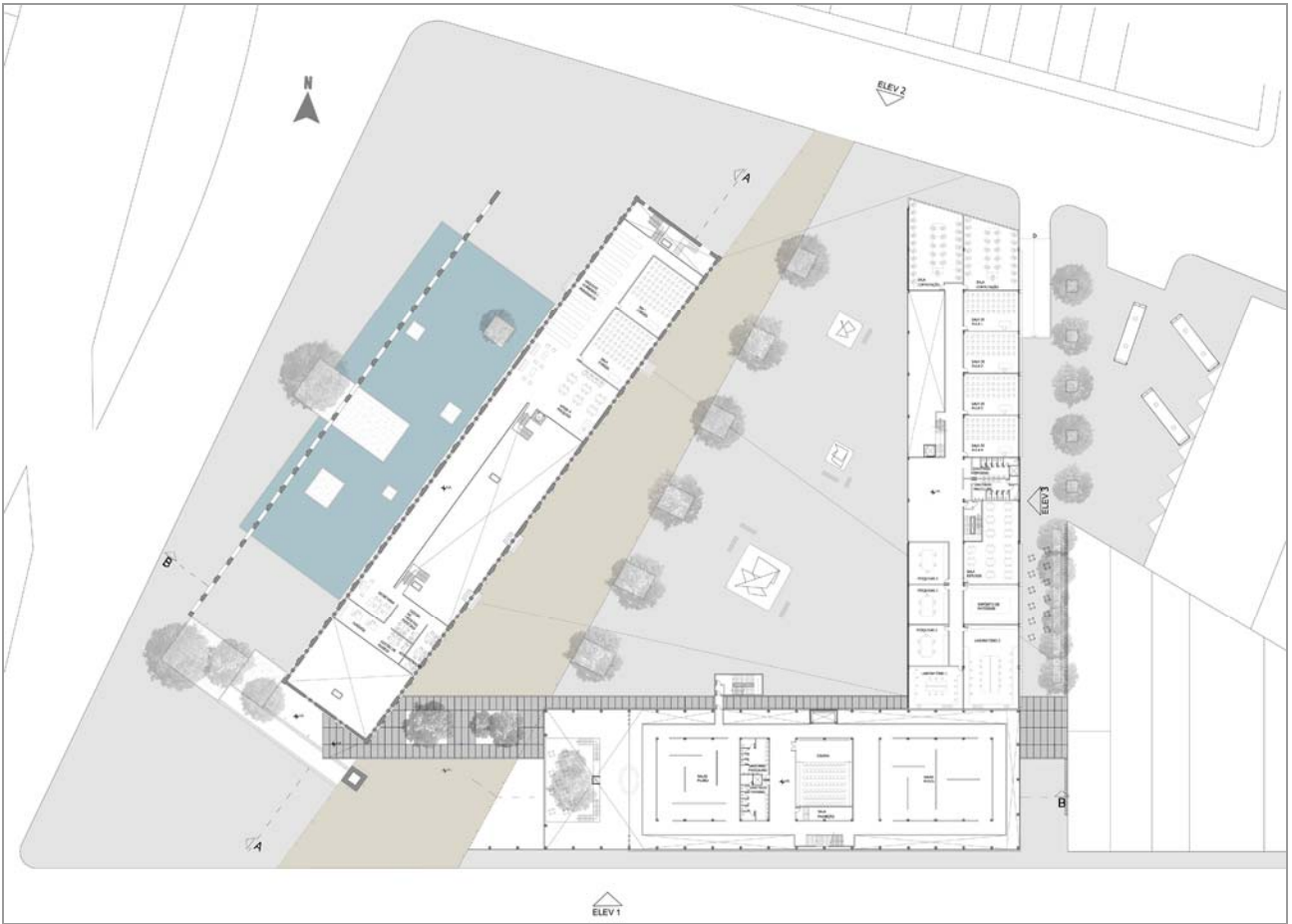
Fig. 9 Planta 1º Pavimento sem escala