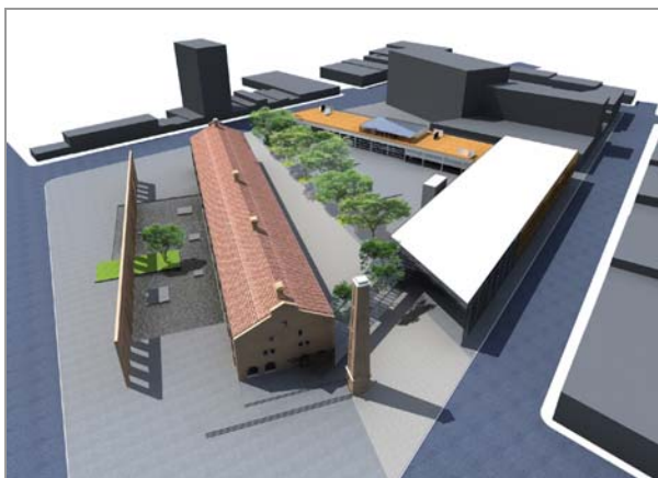
Fig. 4 Imagem aérea do projeto proposto

Patrimônio Histórico-Cultural do Setor Energético de São Paulo, e, conseqüentemente da urbanização e industrialização do Estado de São Paulo, que na época se encontrava locada nos campos da Comgás no Cambuci, em local de difícil acesso pela população. Propus também a demolição de todo o restante da área ocupada pelos edifícios da antiga Usina de Gás, que se encontrava totalmente descaracterizada, devido a utilização entre as décadas de 70 a 90 para outros fins, como, por exemplo, Polícia Militar. A locação da Fundação Patrimônio Histórico da Energia trouxe subsídios para a construção de um grande Museu da Energia, além de um Edifício de Atualização Profissional relacionado à Energia no restante do terreno.