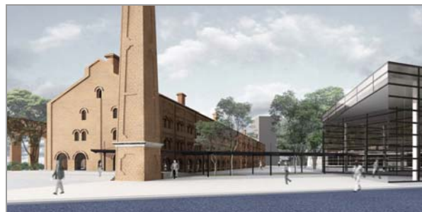
Fig. 6 Imagem geral do projeto

Por último, a marquise, além de ser a ligação física entre os edifícios novos e antigo, procurou ser a resposta contemporânea à adaptação do local para um novo uso, no qual a necessidade de novos espaços convive lado a lado com a utilização dos espaços originais.