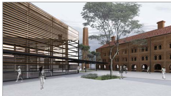
Fig. 5 Detalhe da ligação entre o Museu da Energia e Casa das Retortas através da marquise

Ainda, há uma marquise de ligação entre a Casa das Retortas e os dois novos edifícios, que engloba os três edifícios sem encostar na estrutura da Casa.