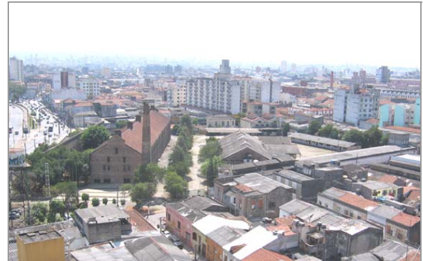
Fig. 2 Vista aérea do local

diversos durante os anos seguintes, sendo que sua última utilização foi como parte de Sede da Prefeitura de São Paulo, até o ano de 2004.