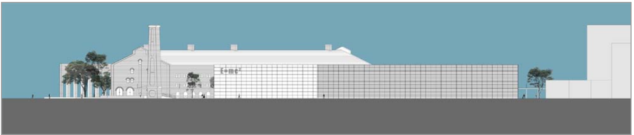
Fig. 12 Elevação 1 sem escala