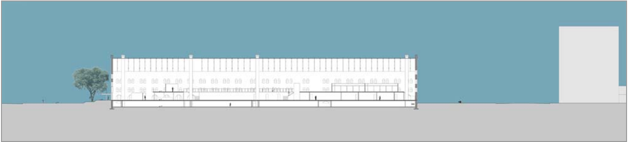
Fig. 10 Corte AA sem escala