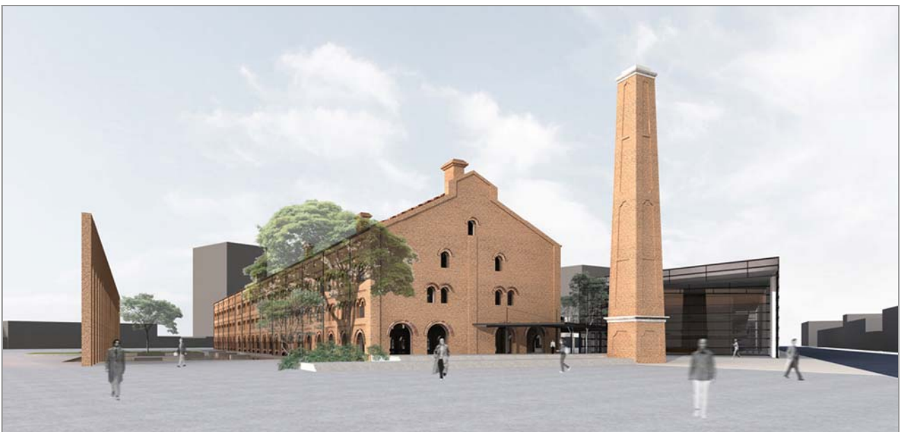
Fig. 15 Imagem geral do projeto