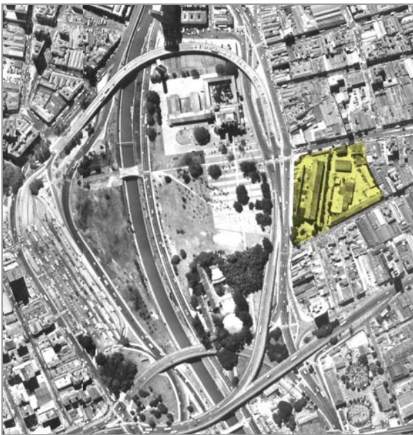
Fig.1 Foto Aérea sem escala mostrando área de estudo

O trabalho envolveu inicialmente a escolha de um bem tombado da cidade de São Paulo, e portanto legalmente protegido que é a Casa das Retortas. Como uma das exigências do exercício acadêmico era a necessidade de construção de uma nova edificação, o local escolhido foi adequado por abrigar no restante do terreno edifícios que pertenceram à primeira Usina de Gás de São Paulo, que atualmente encontram-se vazios, e puderam dar lugar aos edifícios propostos.