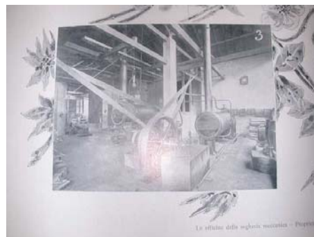
Fig.3- Interior das oficinas Jannuzzi

Talvez essa justificativa seja a mais plausível para a enorme quantidade de esquadrias internas do Prédio Principal/ Hotel executadas com esmerado acabamento e material de origem variada, apesar do curto prazo de obras e com grande quantidade delas em pinho de Riga, material escasso e caro à época, depois da 1ª Guerra.