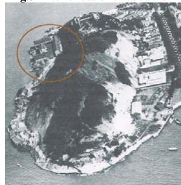
Fig. 4 – Oficinas e serralaria Jannuzzi no Morro da Viúva.

O Caderno de Esquadrias do prédio do Hotel foi realizado em apenas 60 dias para uma quantidade de 463 esquadrias em 19 tipologias de portas e 17 de janelas, num total de 1465 m2 de madeira. As esquadrias do Hotel são, em sua totalidade, diferentes daquelas do prédio do Restaurante. A rapidez e precisão desta segunda etapa, objeto de um trabalho