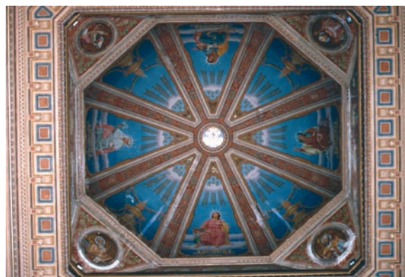
Fig. 2 – Vista da Calota Interna da Cúpula da ICM