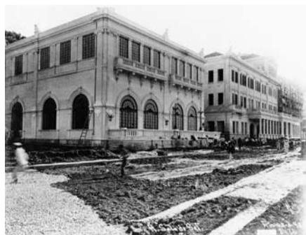
Fig.2 Hotel Sete de Setembro. Botafogo. Malta, 1922.